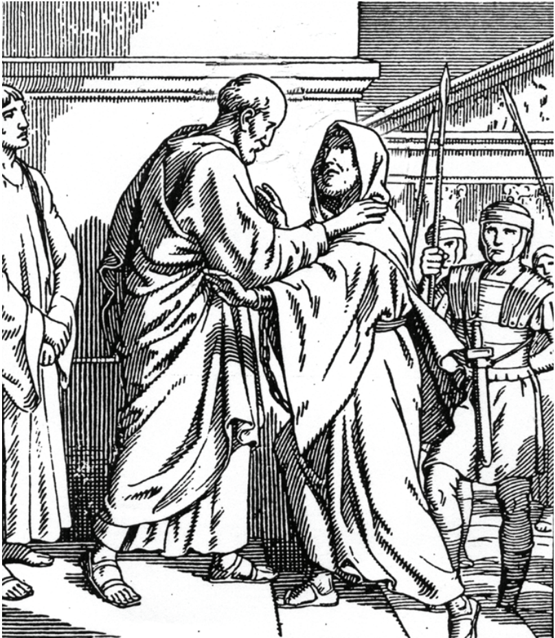
Policarpo de Esmirna recibe a Ignacio en su camino a Roma, custodiado por diez soldados parecidos a leopardos

hecho consolidado y admitido en Siria y en el Asia Menor occidental. W. Bauer ha rebatido esta opinión de un modo convincente, pues, según Bauer, "Ignacio, más que describir hechos, pinta deseos: así lo sugiere la circunstancia de que la mayor parte de sus escritos revisten la forma de la exhortación y no de la descripción". Bauer muestra que Ignacio aspiraba a ser obispo monárquico de Antioquía o incluso de toda Siria, pero de hecho era simplemente el presidente de un grupo que sostenía una difícil lucha de supervivencia contra unos adversarios gnósticos. El episcopado monárquico es un postulado y no todavía una realidad (cit. por P. Vielhauer, op. cit. , p. 565).