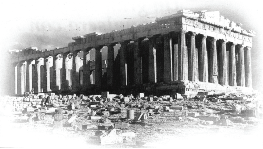
Atenas, donde Cuadrato escribió su Apología a Adriano, identificado por muchos como autor del discurso a Diogneto

La fecha más primitiva (cerca del año 150) es la que parece más probable.