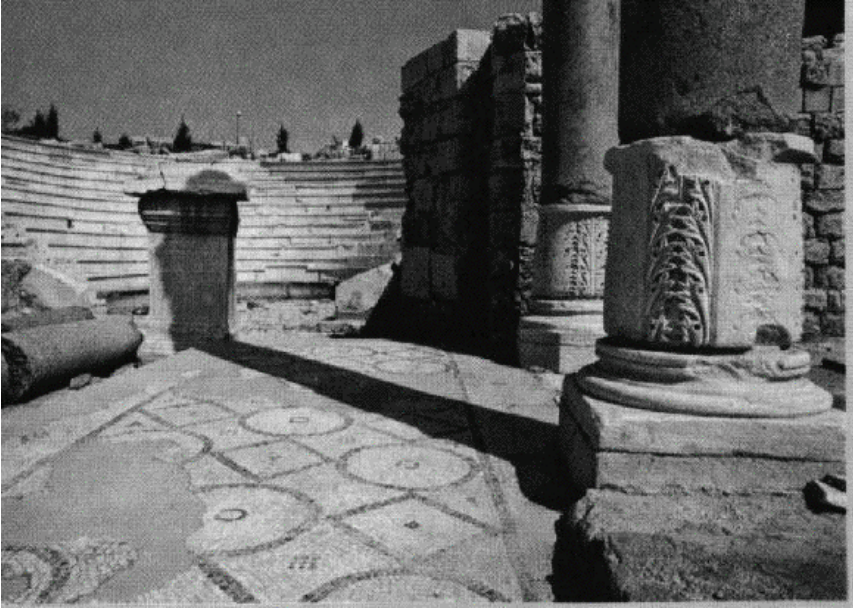
Ruinas del teatro romano de Alejandría, ciudad donde probablemente se escribió la Carta de Bernabé

El redactor de la carta en ningún punto afirma ser el apóstol Bernabé. Procede de la gentilidad.