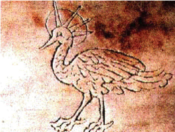
El ave Fénix, inscrita en una catacumba como símbolo de la resurrección futura

Consideremos, la resurrección que tendrá lugar a su debido tiempo. El día y la noche nos muestran la resurrección.