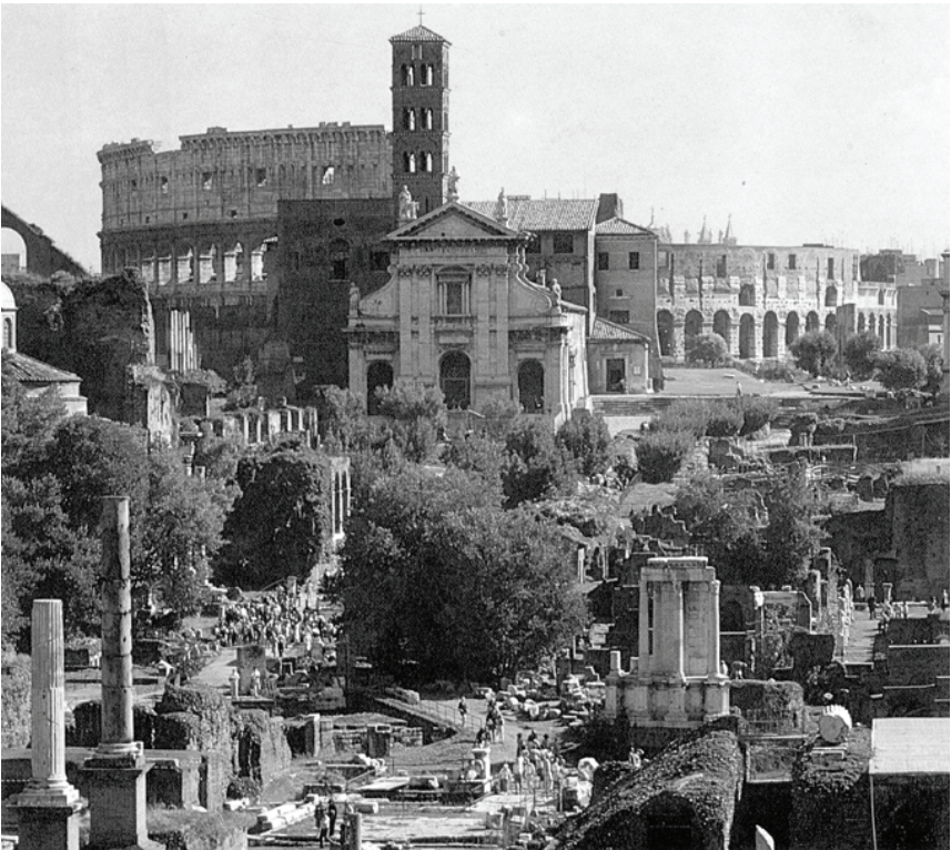
Roma, ciudad donde Hermas escribió su Pastor

Se postula un tercer Hermas intermedio como autor, hacia 90-100.