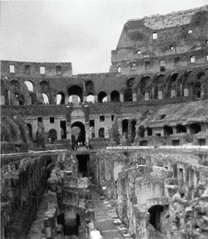
Interior del Coliseo romano, donde Ignacio sufrió el martirio

Las verdaderas reliquias de Ignacio son de orden espiritual, las cartas que dejó como tesoro.