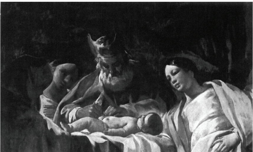
La circuncisión, óleo sobre pared de Goya (1774) Cartuja Aula Dei

El mismo hecho de que el autor del discurso a Diogneto llame a la circuncisión una mutilación de la carne ( Diog. 4), concuerda con el edicto de Adriano, prohibiendo la circuncisión precisamente por considerarla una mutilación del cuerpo, de donde resultó la segunda guerra judía (cf. nuestra "introducción" a las Catequesis de Cirilo de Jerusalén). Todos estos puntos llevan a considerar a Cuadrato el autor del discurso a Diogneto, con un alto