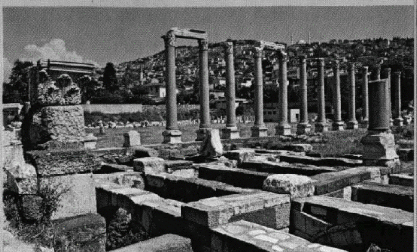
Ruinas de la plaza del mercado de Esmirna, de cuya iglesia Policarpo era obispo

Policarpo escribe contra la especulación gnóstica, que tiene a Valentín por su portavoz más representativo.