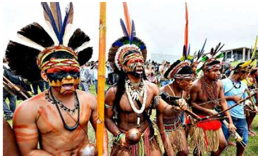
Meta capital de la misiología “aggiornata”: un orden nuevo para la sociedad terrena tomando como ejemplo a los indígenas