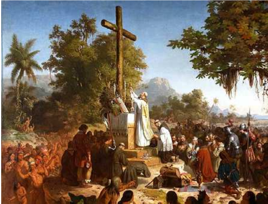
La concepción católica tradicional de las Misiones

En la doctrina misiológica de la Iglesia, tradicional de cerca de veinte siglos, el concepto de Misión católica, sus fines y sus métodos, están perfectamente definidos, y coincide con el modo de ver y de sentir del lector brasileño medio.