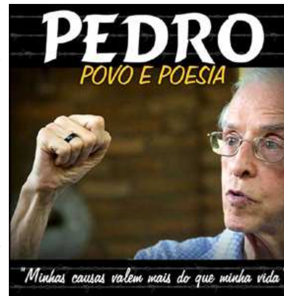
La corriente neomisionera tiene fuerte apoyo en medios eclesiásticos. Uno de sus representantes es Mons. Pedro Casaldaliga, Obispo de San Félix de Araguaia, quién se declara “transcomunista”

Lector, intérese. Divulgue de todos los modos, en torno de sí, el conocimiento de la embestida “neocomunista”. Y le cabrá la gloria de haber contribuido, con su voz, para el gran grito de alerta que puede salvar al Brasil.